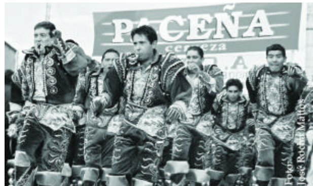
Caporales beim Karneval von Oruro

Tänzen, bei denen alle Dorfmitglieder mitmachen, ist die Morenada elitär. In den Dörfern ist sie daher vermutlich auch deshalb so beliebt, weil sie es den Prestes oder Pasantes („Paten“, die [Dorf]feste ausrichten und finanzieren) ermöglicht, ihren Erfolg in der Stadt, verbunden mit sozialem und wirtschaftlichen Aufstieg, zu zeigen.