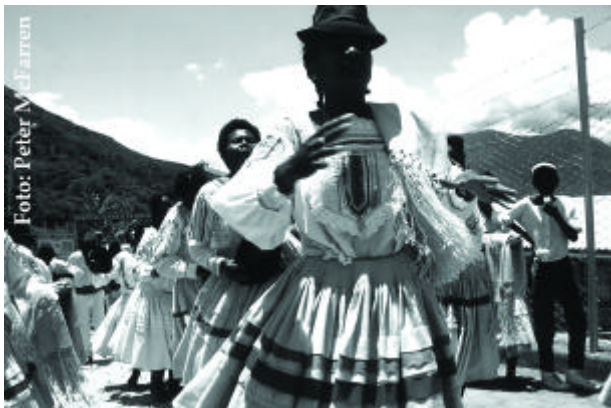
Saya afro-boliviana in den Yungas