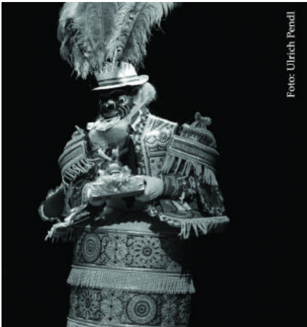
Moreno mit schwarzer Maske und „Tonnenkostüm“

Ursprünglich von der Aufführung einer afro-bolivianischen Gruppe aus Tocaña inspiriert und 1969 von den Brüdern Estrada Pacheco kreiert, entwickelte der Caporales -Tanz sehr bald eine große Eigendynamik. Von Anfang an als Tanz für die junge Generation konzipiert, inkorpo-